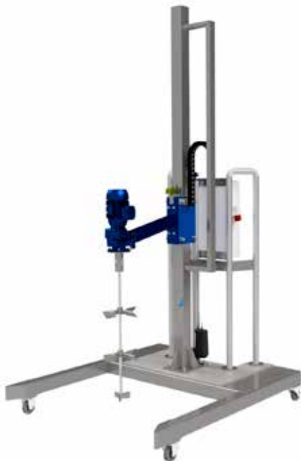
IBC konteynerler için Taşınabilir Karıştırma İstasyonu