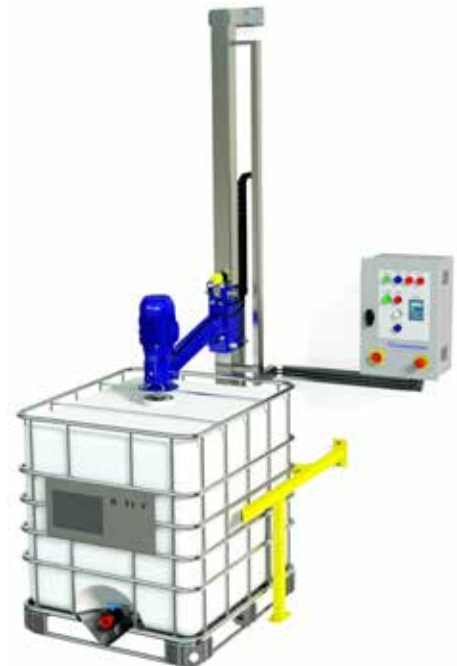
IBC konteynerler için Sabit Karıştırma İstasyonu